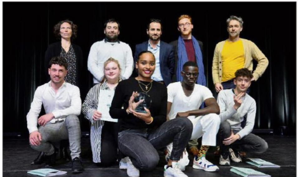
Jury et finalistes de la première édition « L'art de dire » de la saison Gatti.

Une épreuve surmontée haut la main et décortiquée par le jury. La posture, la diction, la véracité de l'analyse