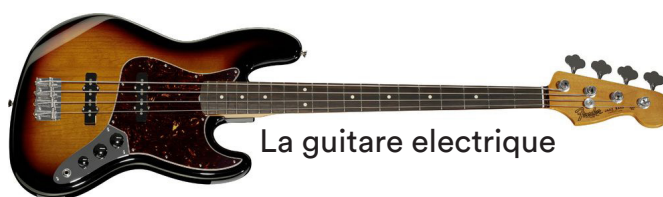
La guitare électrique