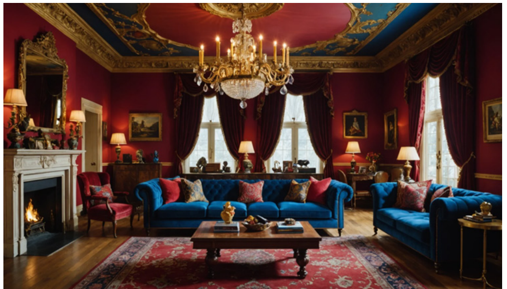
Le style baroque