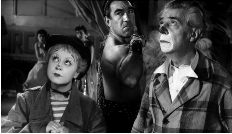
Esthétique des films de Fellini