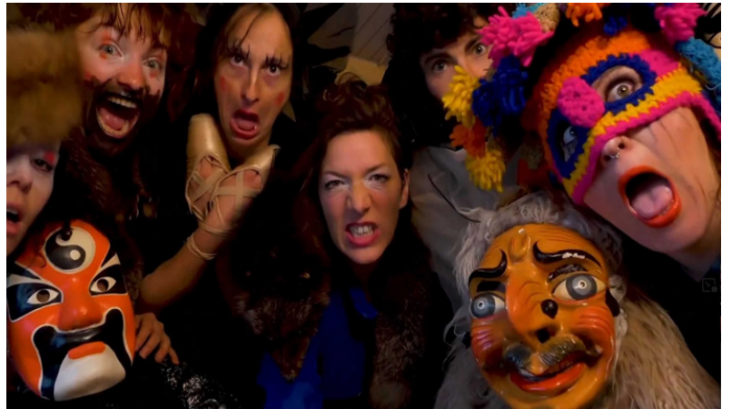
Le spectacle «Le Bruit»